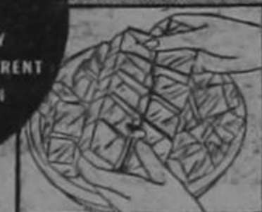
Plenty of ice cubes with Electrolux