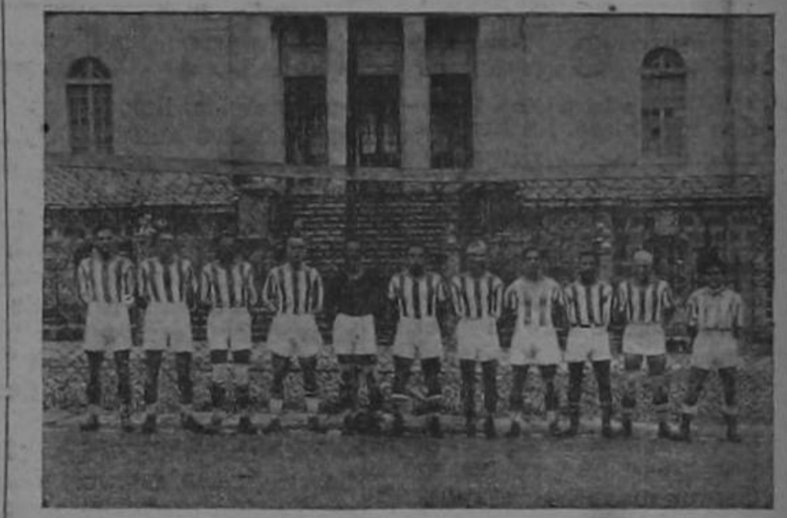
The Cartago Team