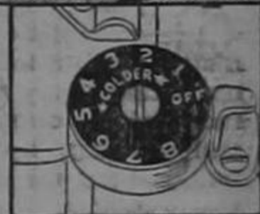
Temperature regulator speeds freezing